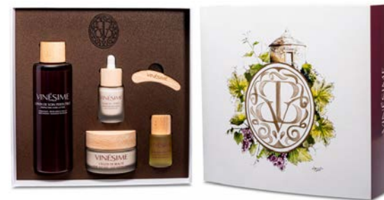
COFFRET LUXE PINOT NOIR