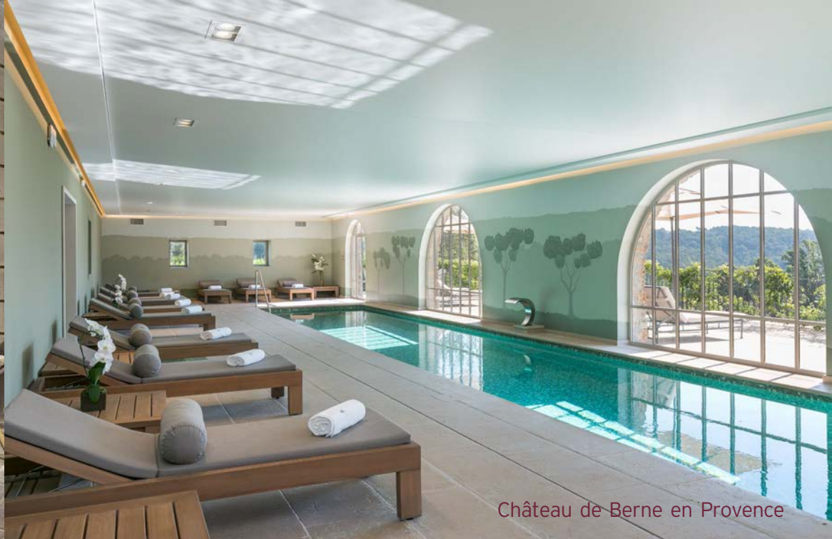
Château de Berne en Provence