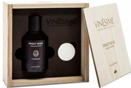
EAU DE PARFUM PINOT NOIR