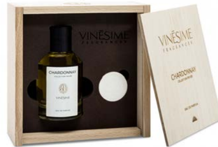
EAU DE PARFUM CHARDONNAY