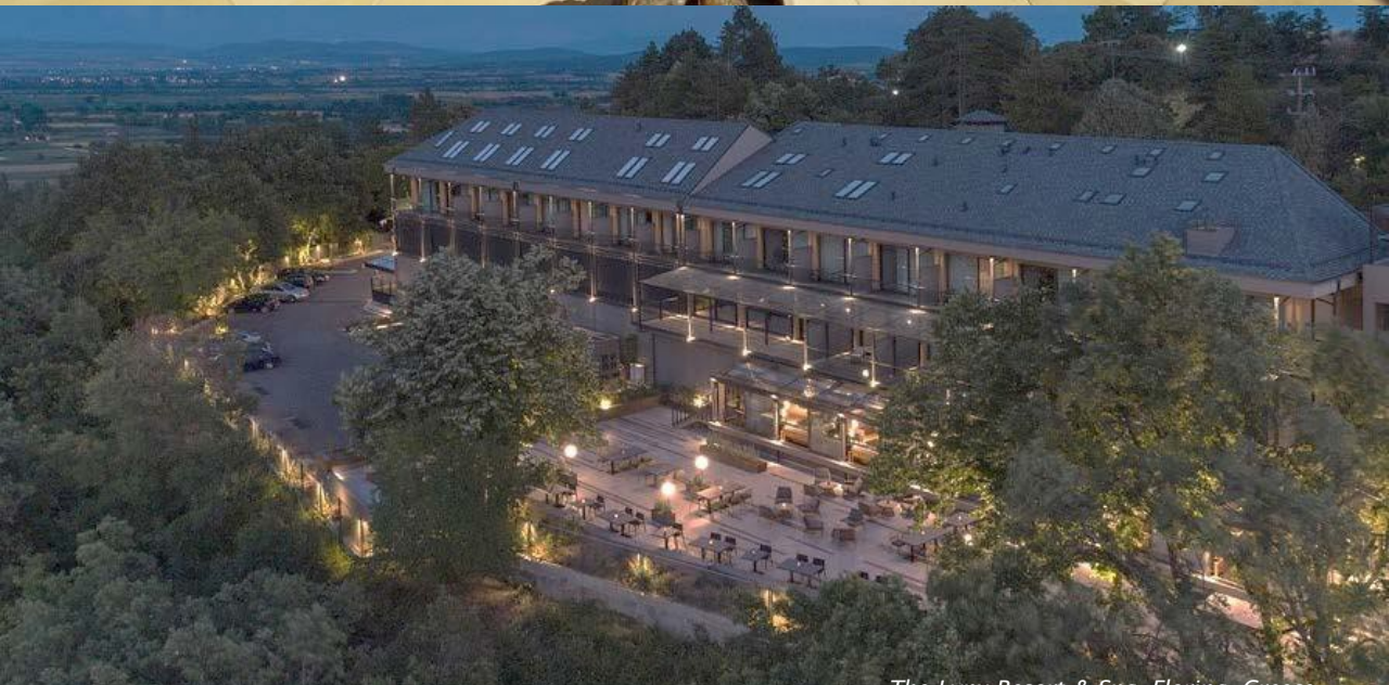
The Lynx Resort & Spa, Florina, Greece