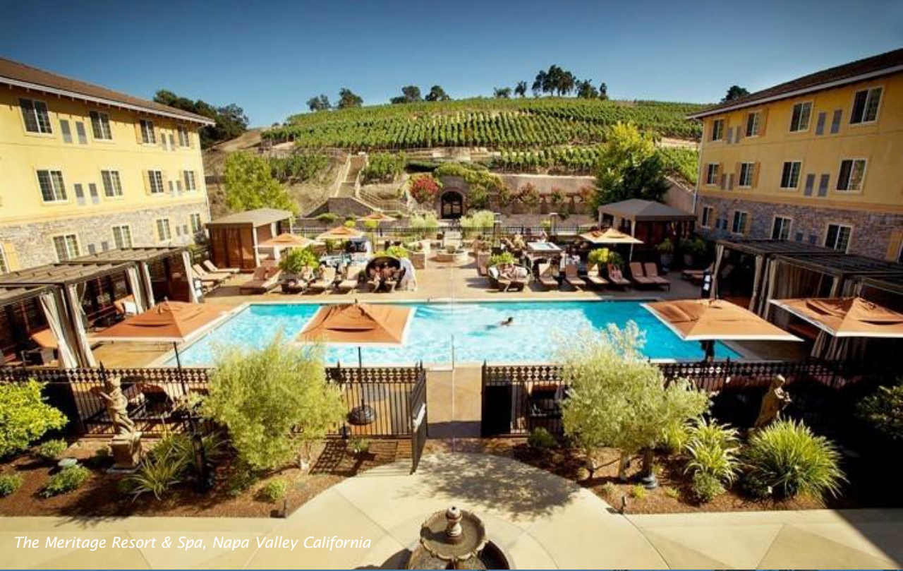
The Meritage Resort & Spa, Napa Valley California