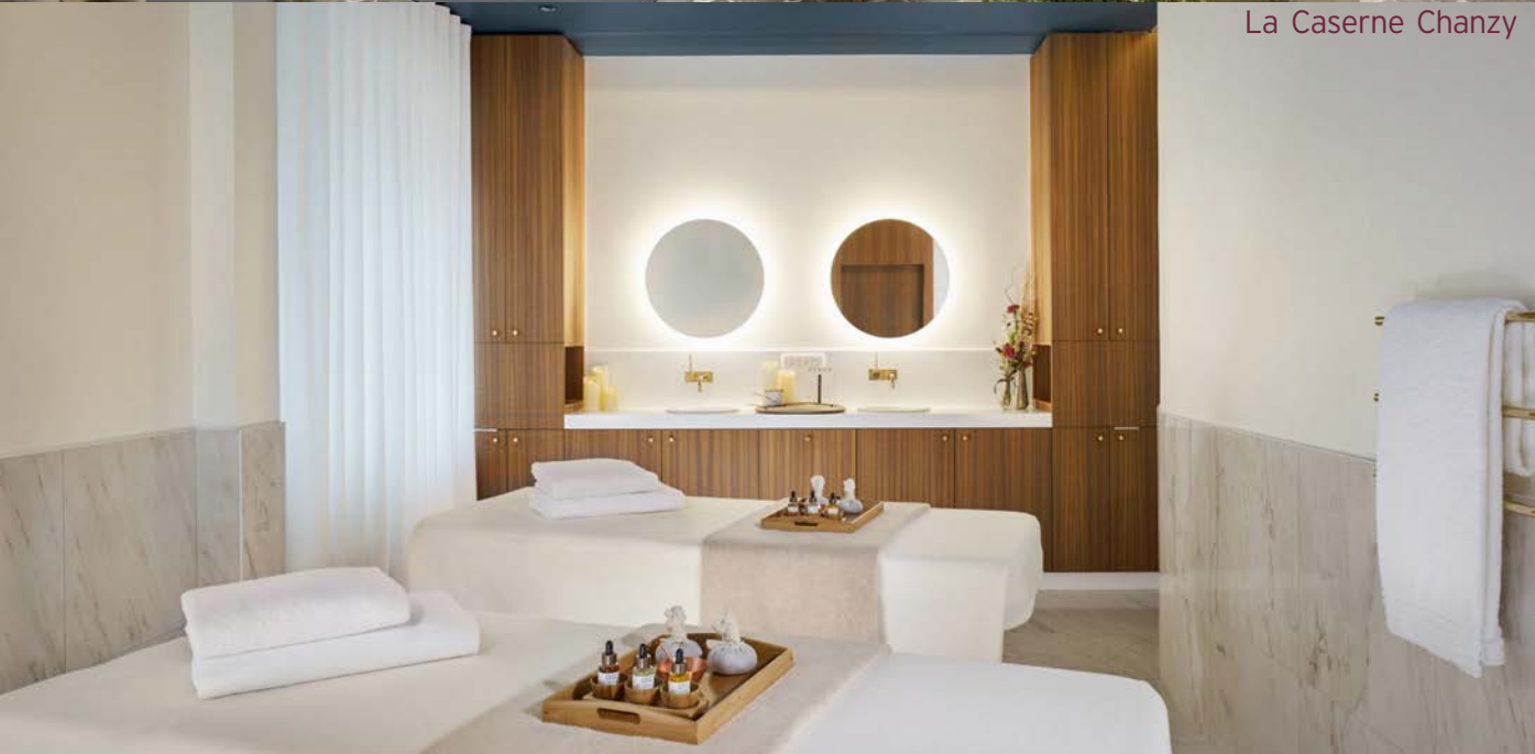
La Caserne Chanzy