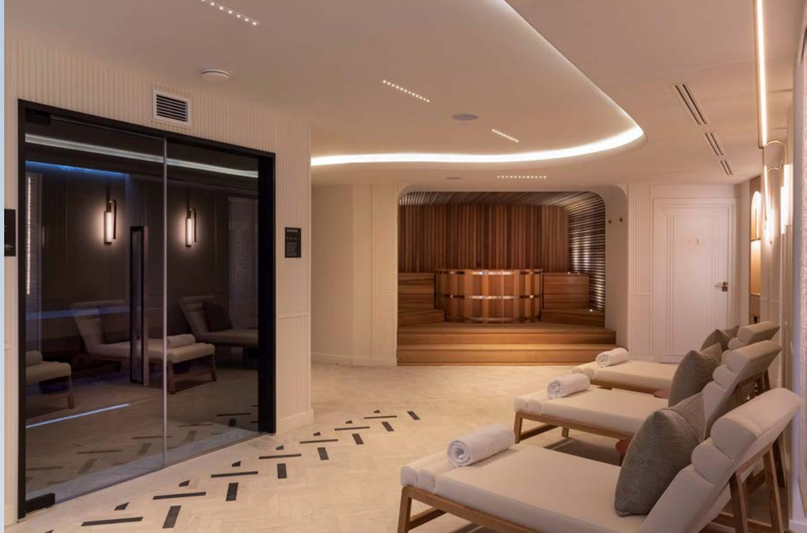
Hôtel Maison Rouge