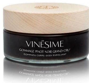
GOMMAGE CORPS PINOT NOIR Richebourg Grand Cru