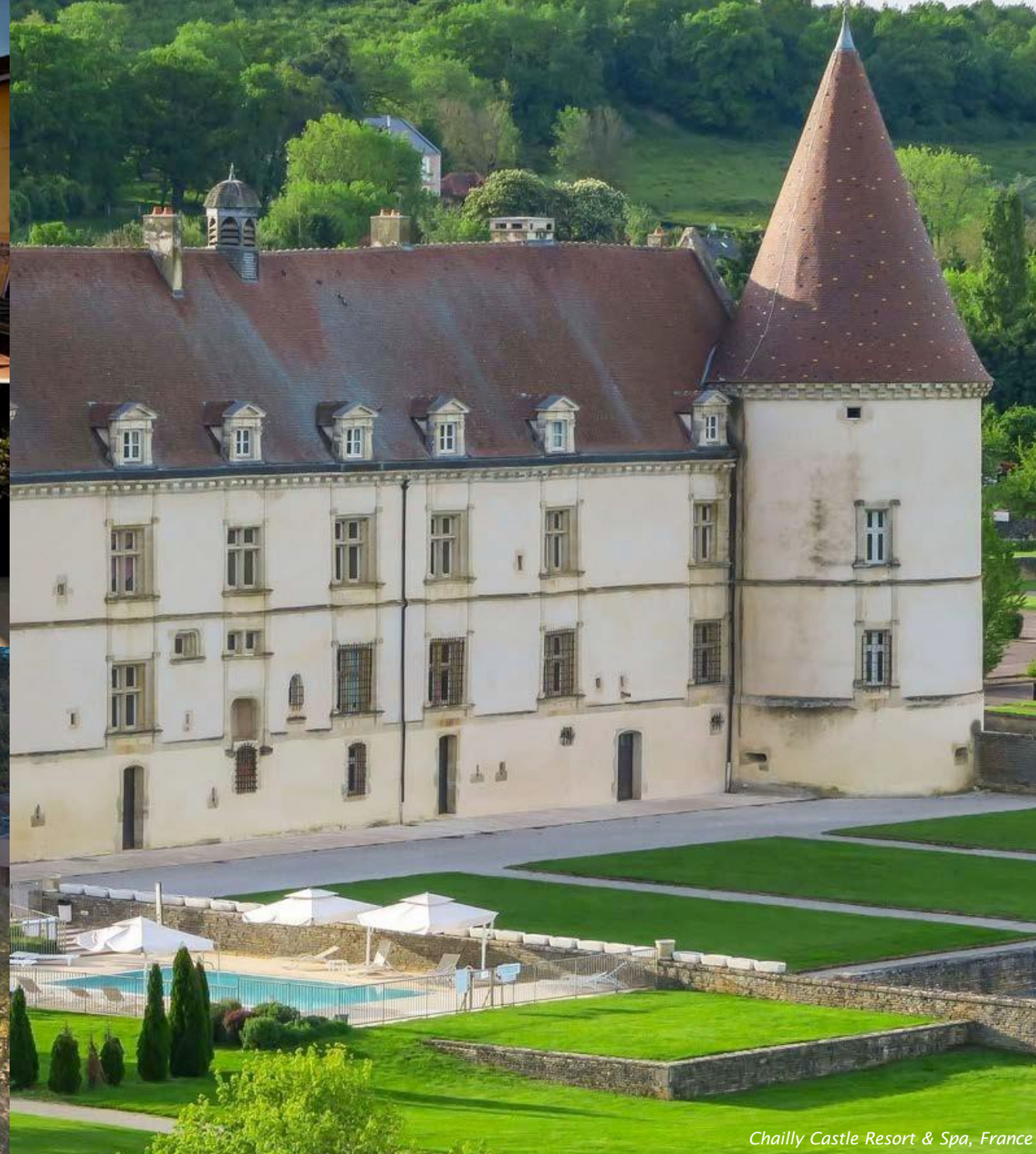
Chailly Castle Resort & Spa, France