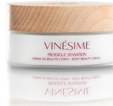
PRODIGE SENSATION Crème riche pour le corps