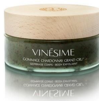
GOMMAGE CHARDONNAY Chablis Grand Cru